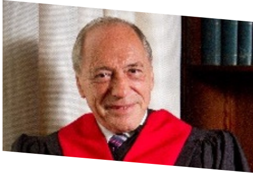
DR. RAÚL ZAFFARONI ARGENTINA